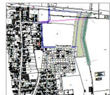
Lageplan M 1:5000